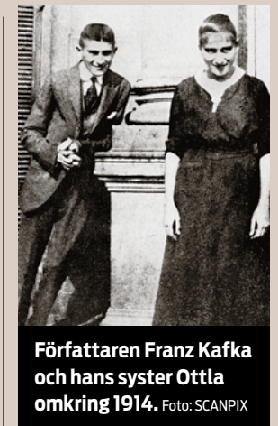
Författaren Franz Kafka och hans syster Ottla omkring 1914.

Litterära utkast och fragment varvas med iakttagelser och personliga reflektioner, korta skisser