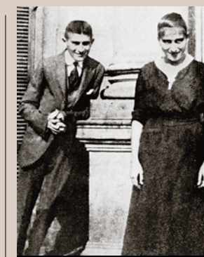
Författaren Franz Kafka och hans syster Ottla omkring 1914.

Litterära utkast och fragment varvas med iakttagelser och personliga reflektioner, korta skisser