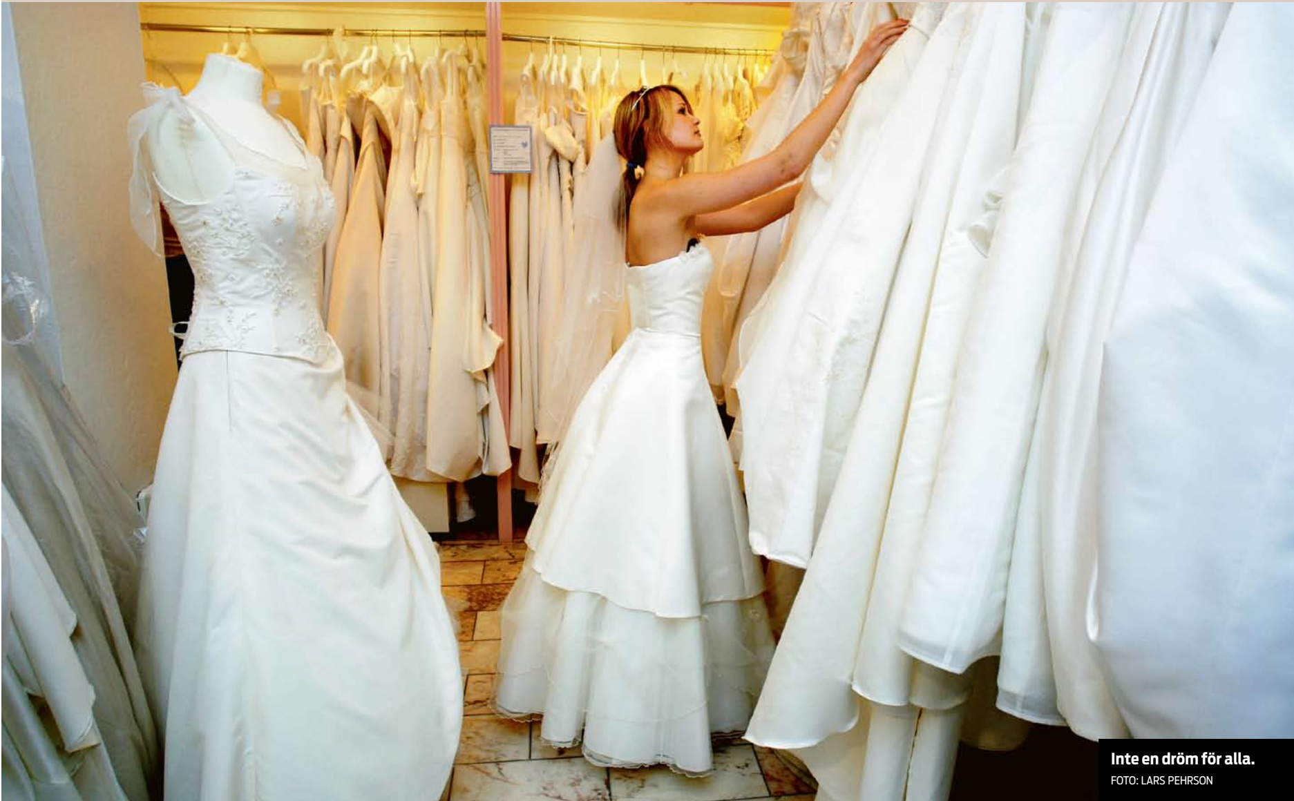
Inte en dröm för alla.

LITTERATUR · OGIFTA UTSÄTTS FÖR PRESS AV SAMHÄLLSNORMEN