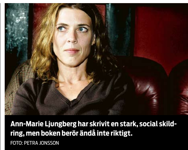
Ann-Marie Ljungberg har skrivit en stark, social skildring, men boken berör ändå inte riktigt.

Den roman som hon skrivit handlar både om tiden, politiken, kriget och stämningen runt en grupp av män som förbereder ett terroristdåd. Romanen bygger på rättegångsprotokollen mot attentatsmännen,